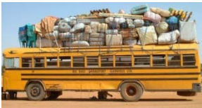
Direction Lomé - Tour de ville