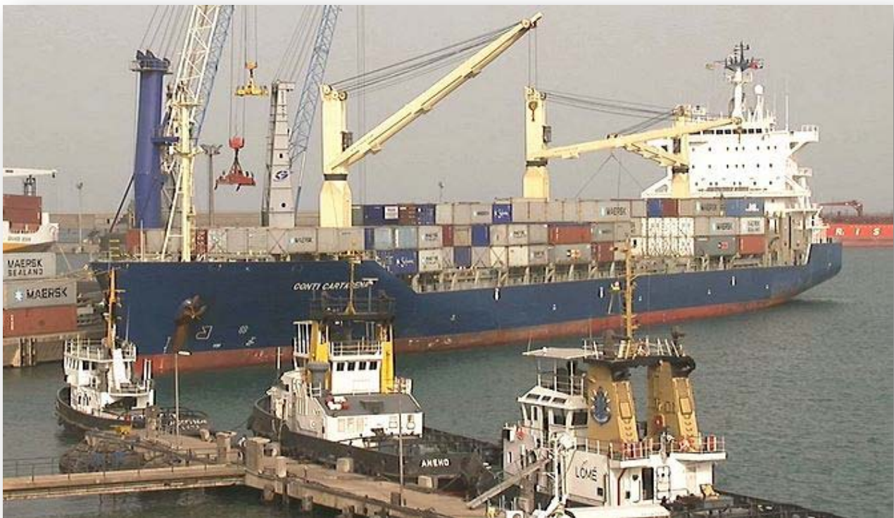
Le port autonome de Lomé