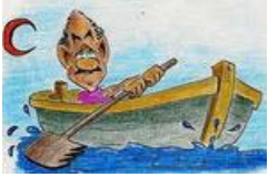
Barque sur le lac Togo - Togoville - Marché du Troc