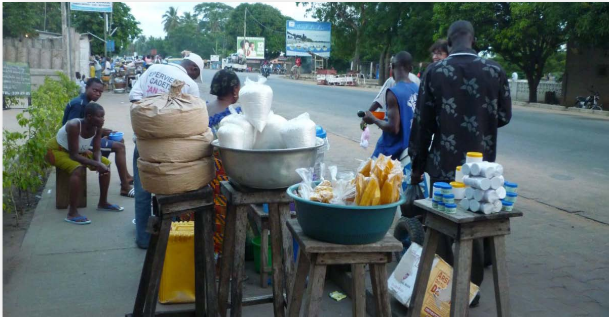
Route principale à Agbodrafo