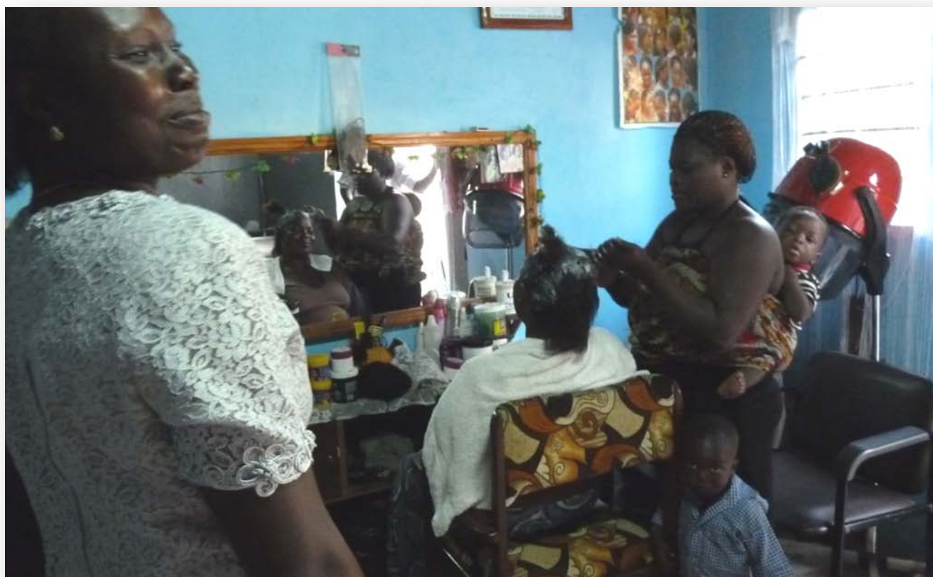
Chez le coiffeur