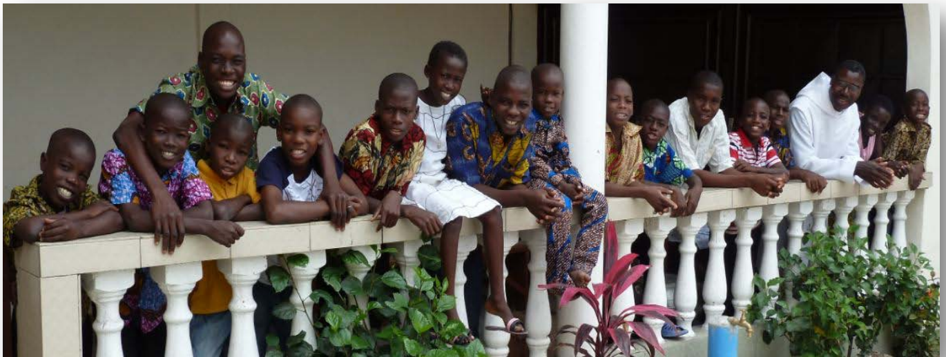
Foyer des orphelins