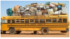
Départ pour Baguida