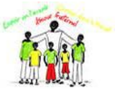
Quartier d'Adidogomé - Foyer Saint Joseph