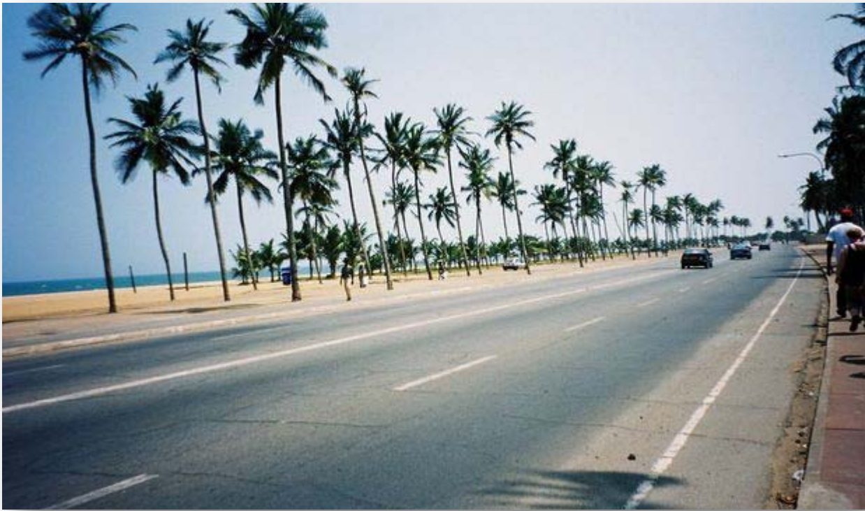
des kms de plage à Lomé