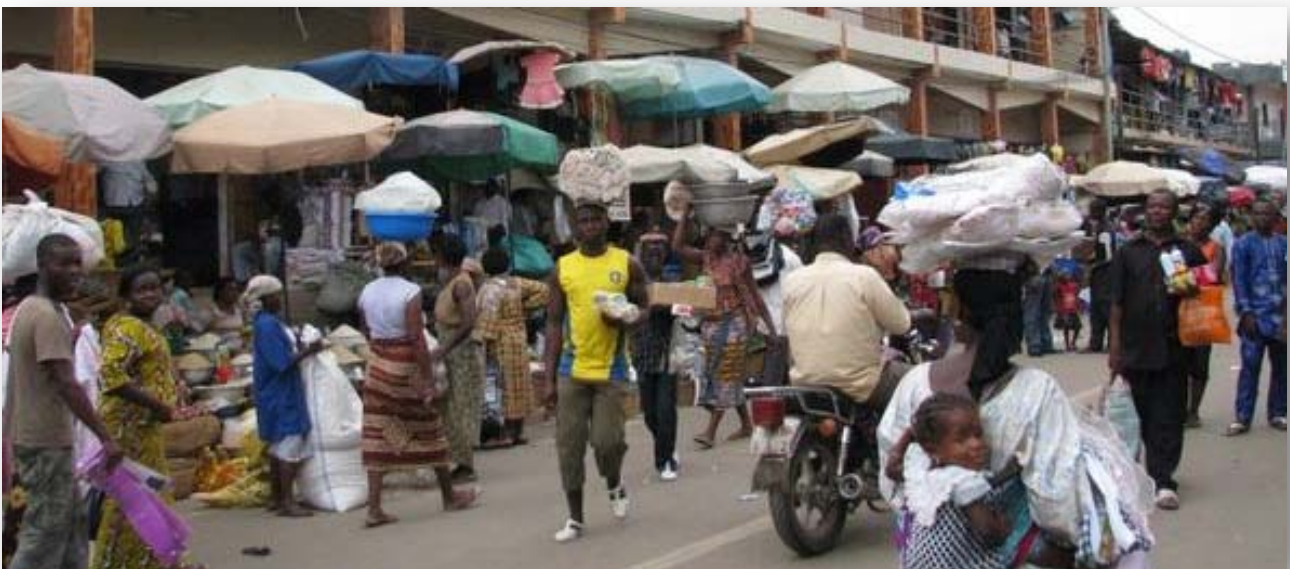
Le Marché de Lomé