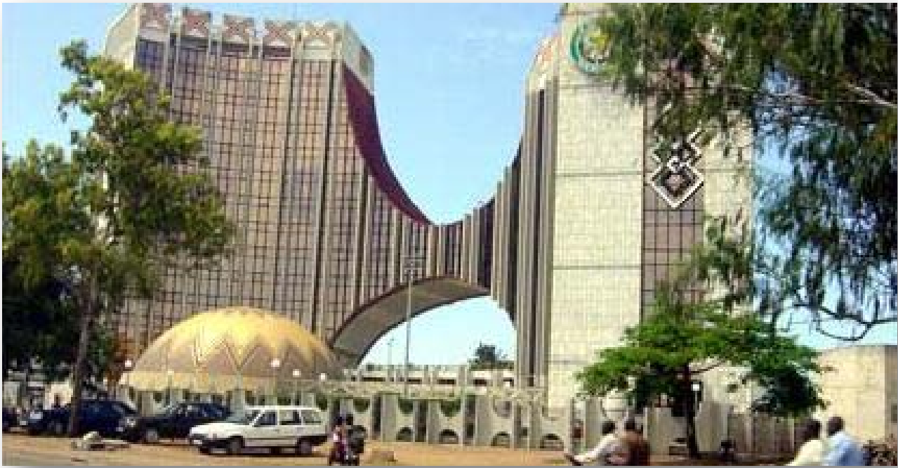
Siège de la Communauté économique Des États de l'Afrique de l'Ouest