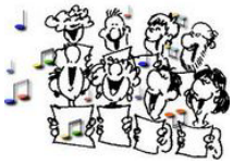
Répétition Chante Lyre Villa Apéléte